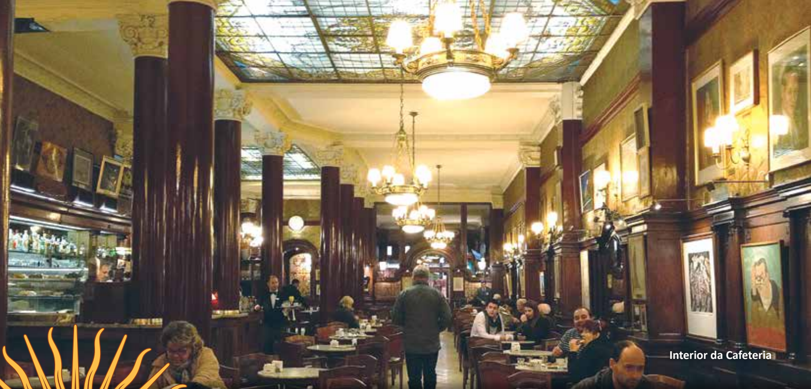
Interior da Cafeteria