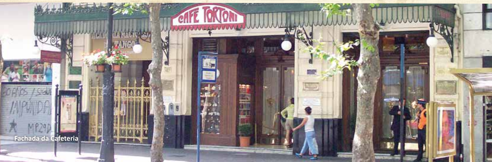
Fachada da Cafeteria